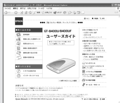
ユーザーズガイド メイン画面