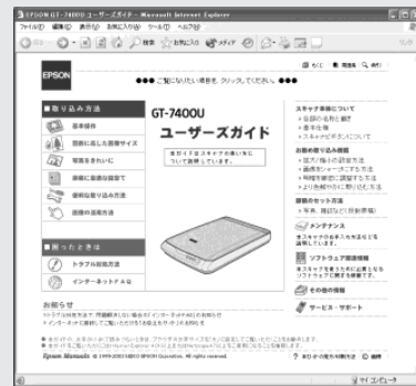
ユーザーズガイド メイン画面