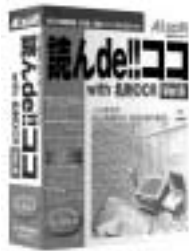
読ん de!! ココ Ver.6 with 名刺 OCR アップグレード版 ¥7,500

お手持ちの「読ん de!! ココ for EPSON」から、最新の「読ん de!! ココ」シリーズに、アップグレードすることができます。OCRの更なる活用を検討されているユーザー様は、この機会に是非、最新製品へのアップグレードをご検討下さい。読ん de!! ココのアップグレードは、次ページ記載のお申し込み要領で直接弊社にお申し込み頂ける他、店頭で手軽にアップグレードができる様、全国のパソコンショップで「読ん de!! ココ Ver.6 with 名刺 OCR アップグレード版」及び「読ん de!! ココ Ver.6 with 名刺 OCR Power OCR Suite アップグレード版」の販売も行なっております。製品の詳細は「読ん de!! ココ Ver.6 with 名刺 OCR」については7P、「読ん de!! ココ Ver.6 with 名刺 OCR Power OCR Suite」については8Pをご覧ください。