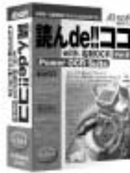
読ん de!! ココ Ver.6 with 名刺 OCR Power OCR Suite アップグレード版 ¥17,500