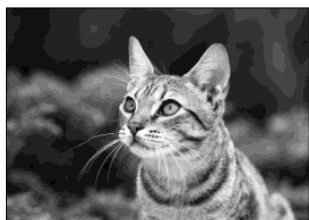
フチなしの A4 サイズの写真