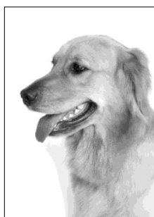
周囲に白い部分がある原稿

しかし以下のように、周囲に白い部分がある原稿を使用すると、正しくコピーできない場合があります。