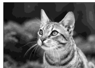
正常にコピーできました。

しかし以下のように、周囲に白い部分がある原稿を使用すると、正しくコピーできない場合があります。