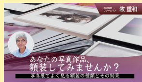
あなたの写真作品、額装してみませんか? 写真展でよく見る額装の種類とその効果 あなたの写真作品、額装してみませんか? 【全2回】