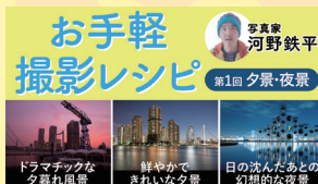
お手軽撮影レシピ 第1回 夕景・夜景 お手軽撮影レシピ (第1回 夕景・夜景)