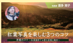
紅葉写真を楽しむ3つのコツ 準備のコツ-紅葉撮影に必要な装備と機材- 【全3回】