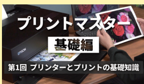
プリントマスター<基礎編> (第1回 プリンターとプリントの基礎知識)