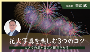
花火写真を楽しむ3つのコツ カメラの基本設定と道具を知る 【全3回】