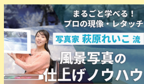
まるごと学べる!プロの現像・レタッチ 写真家 萩原れいこ流 風景写真の仕上げノウハウ