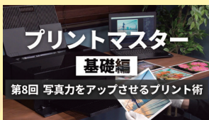
プリントマスター<基礎編> (第8回 写真力をアップさせるプリント術)