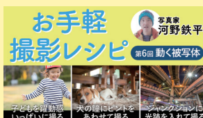
お手軽撮影レシピ 第6回 動く被写体 お手軽撮影レシピ (第6回 動く被写体)