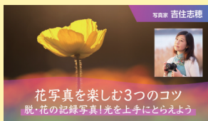
花写真を楽しむ3つのコツ 脱・花の記録写真!光を上手にとらえよう 【全3回】

脱・花の記録写真! ボケをコントロールしてワンランク上の 花写真にするコツを学ぼう