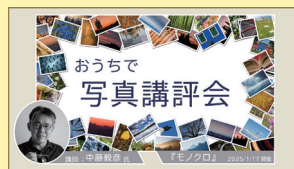
プレミアムイベントおうちで写真講習会 テーマ:風景・花・モノクロ・スナップ