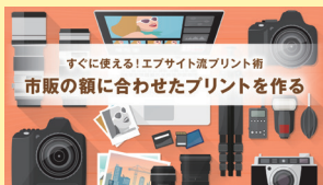
すぐに使える!エプサイト流プリント術 市販の額に合わせたプリントを作る