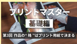
プリントマスター<基礎編> (第3回 作品の格はプリント用紙で決まる)