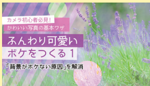
ふんわり可愛いボケをつくる! 【全2回】