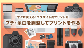
すぐに使える!エプサイト流プリント術 フチ・余白を調整してプリントを作る