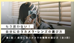
もう迷わない! 自分に合うカメラ・レンズの選び方 第1回 / 自分に合うカメラの種類と選び方 (全3回) もう迷わない!自分に合うカメラ・レンズの選び方 【全3回】