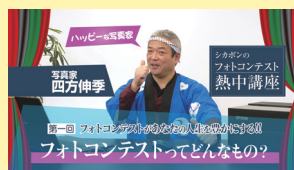
シカゴンのフォトコンテスト熱中講座 【全3回】