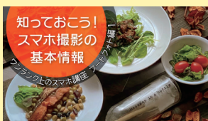
知っておこう! スマホ撮影の 基本情報 【全3回】