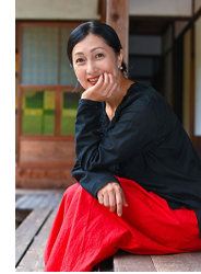
鶴田真由 プロフィール

1988年女優デビュー。その後、ドラマ、映画、舞台、CMと幅広く活動。1996年には「きけ、わたつみの声」で日本アカデミー賞優秀助演女優賞を受賞。近年はドラマ「らんまん」「誰かがこの町で」「あなたを奪ったその日から」、映画「日は好日」「ノイズ」「やがて海へと届く」など話題作に出演。旅をきっかけに写真を撮り始め、2017年ニコプラザTHE GALLERYにてカメラマン小林紀晴氏のカラー写真展「Silence of India」を開催。同時に同タイトルの写真集を発売(赤々舎)。これ以後発表の場が増え、個展「KATARIBE」ほか、2025年夏には中国上海にあるSigma Chinaにて展覧会「灰燼里的金 (Gold in the Ashes)」が開催された。