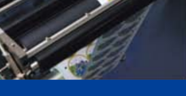
抜き加工はアレンデータグラフのカッティングプロッタを活用