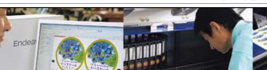
昨年9月にデジタル印刷機「SurePress」を導入

同社は「提案営業」を推進している。同社は、現場で課題を解決する提案営業を推進している。同社は、現場で課題を解決する提案営業を推進している。