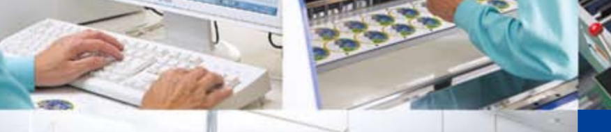
抜き加工はアレンデータグラフのカッティングプロッタを活用