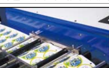
昨年9月にデジタル印刷機「SurePress」を導入