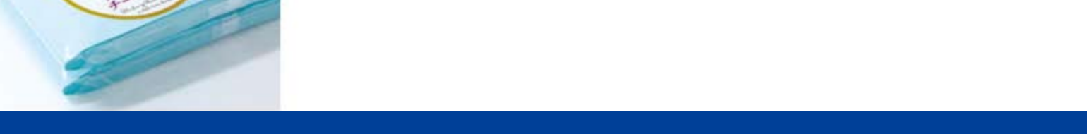
抜き加工はアレンデータグラフのカッティングプロッタを活用