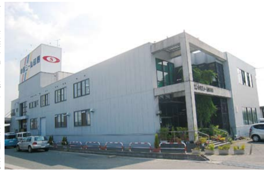
県内でも長い歴史を誇る同社、ユニークな事業展開を推進

同社は現在、従業員80人で、うち印刷オペレーターは20人、営業担当は本社に11人、東京営業所に5人の計16人。