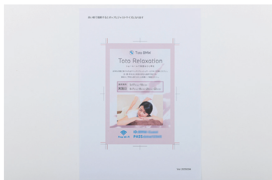
店舗では様々なイベントを開催しており、それを案内するPOPツールにも活用している。 画像も高精細でイベントのイメージも伝えやすい。