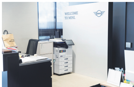
受付カウンターの裏側にLM-C400大容量給紙モデルを設置。コンパクトで省スペース、自立式で設置ができ、最大2,300枚の給紙ができるので用紙の交換頻度が大幅に軽減。