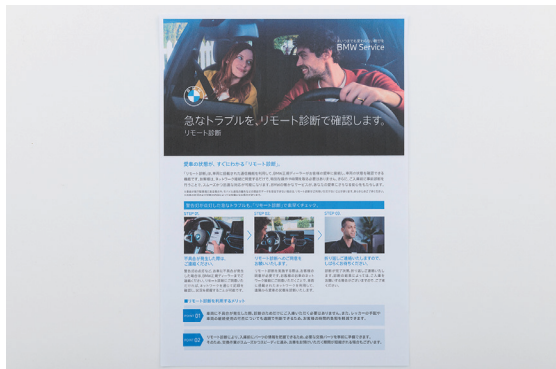
納車時や相談・接客時に渡す、リモート診断の案内書なども複合機で印刷している。