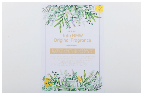
店舗で販売しているモーターレーン東都オリジナルフレグランスの案内チラシ。 カラーのイラストが使えるので商品の雰囲気も伝えやすい。

見落としが許されない書類は、今までは人の目で確認して、手作業で文字起こしなどをしていましたが、OCR機能を使えば正確な読取りで、検索可能なPDFデータ化による保管もできると考えており、今後の役割として大きく期待しています。現在はその都度、必要な書類をスキャンして、社内SNSサービスを使って共有したりしていますが、今後はスキャンした書類のPDFデータをサーバーに上げて、全店舗で共有・検索・修正できるようにすれば、作業の手間や時間が減って業務効率上がり、顧客満足度もさらに向上できると思っています。