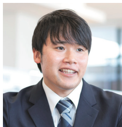
株式会社モトーレン東都 経営本部 総務課