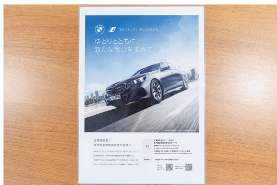
商談テーブル上に置くPOPツールなどにも複合機を活用。カラー印刷してラミネート加工して設置、QRコードもクリアに印刷できる。