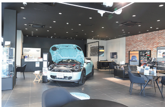
道路を挟んで斜め向いにあるMINI西東京ショールーム。カジュアルな雰囲気の内装でMINIの世界観が演出されており、複合機は左奥の受付カウンターの裏側へ設置されている。