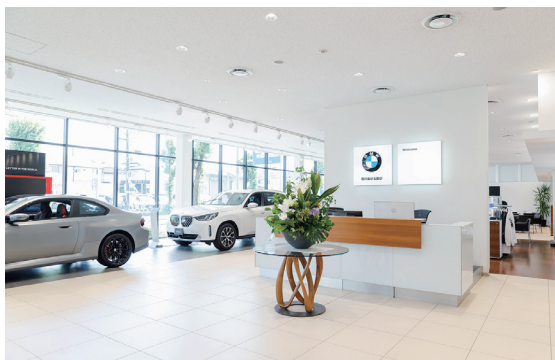
TotoBMW西東京本社のショールーム。白を基調にしたスッキリとした寛ぎの空間でお客様との商談や、車検・点検・修理の相談などに対応している。

また、ブランド規定で、設置機器はカウンター背面のグラフィックボードに被らない配置にする必要があり、年1回のディーラー監査でもチェックがあるため、設置スペースや機器のボリューム感が心配でしたが、「A4カラーラインインクジェット複合機 LM-C400 大容量給紙モデル」なら、筐体がコンパクトで高さも低く、4段カセットの床置設置なので、グラフィックボードにも掛からず、カウンター周りにスッキリと配置することができました。