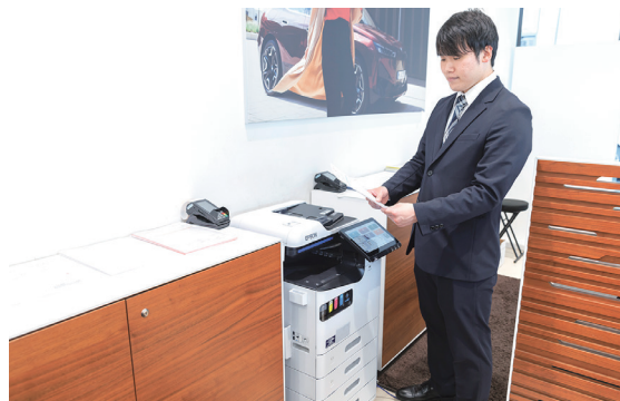
総合受付右手の車検・点検・修理などの相談カウンター後ろの壁際に、LM-C400大容量給紙モデルを設置。コンパクトで高さも低いので、上部のビジュアルに被らず安全に使用できる。