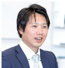
株式会社モトーレン東都 経営本部 総務課 係長