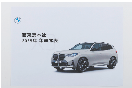
発表会に配布する冊子資料の印刷にも活用。大量印刷したい場合も高速で印刷できるので、様々な用途で役立っている。