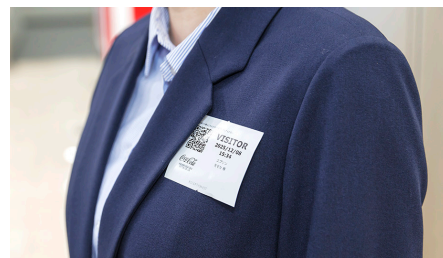
入館証シールはお客様の衣服などに貼付していただく。