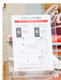
受付方法を案内する パネルを設置。