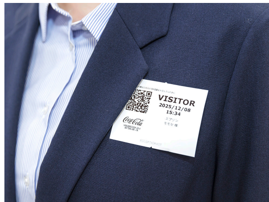
TM-L100で印刷された入館証シール。来客であることがひと目で分かる。台紙なしラベル。印刷したら、そのまま貼れる。