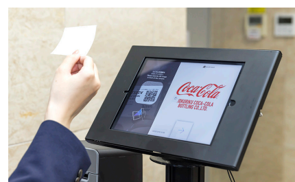
左図パネル通りの操作で退館時の操作もスムーズ。