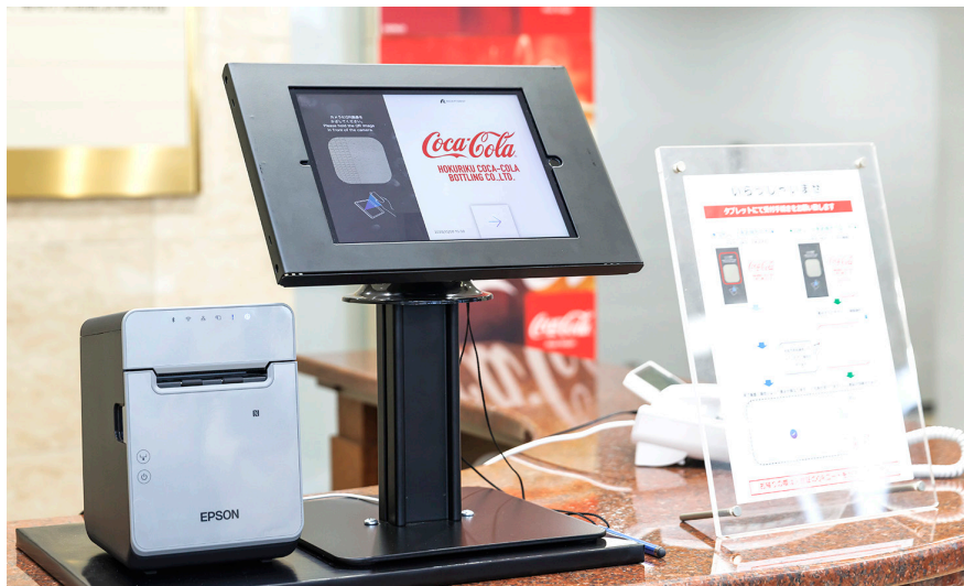
北陸コカ・コーラボトリング株式会社様の受付。iPadと「TM-L100」を使い来客受付対応を行っている。