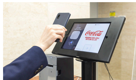
お客様は受付に設置されたiPadにQRコードをかざして受付を行う。

「いくつかのシステムを比較検討した結果、使いやすさや導入コストなどを総合的に判断し、クラウド受付システム『RECEPTIONIST』の採用を決定しました。検討には社内のシステム関連部署のスタッフにも参加してもらい、専門家からも「このシステムなら安心して使える」という評価を得られたことが、選定を後押しする大きな要因になりました。また、従来からエプソンのプロジェクターを使用しており、エプソンには強い信頼感がありました。そのため、『RECEPTIONIST』と連携するラベルプリンターとして、信頼性の高い『TM-L100』を採用しました。」