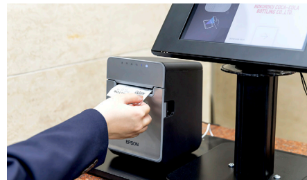
「TM-L100」から強粘着タイプの入館証シールが印刷される。