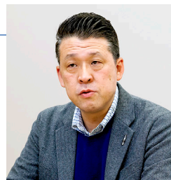
北陸コカ・コーラボトリング株式会社 総務部総務課課長