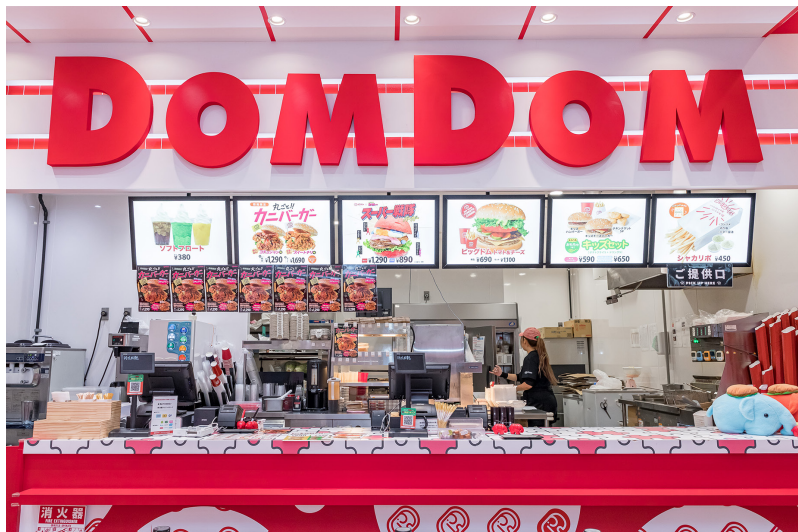
ドムドムハンバーガー様の店舗内 (POSタブレットと「TM-m55」を組み合わせたレジカウンター)