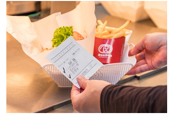
「TM-m55」で印刷した取り揃え伝票でメニューの最終チェックを行う

今後は年間3～5店舗のペースで導入を拡大し、スタッフが安心して働ける環境づくりと、さらなるサービス品質の向上を両立させていく予定です。」