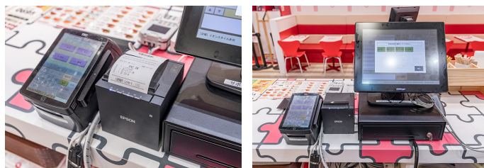
スピーディな印刷と省スペース設計の「TM-m55」。店舗デザインにあわせブラックモデルを採用。

稼働とスピーディな印刷性能により、商品提供の迅速化とスタッフの作業効率化を同時支援しています。