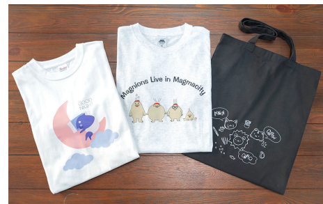
解像度や1層・2層カラーなど、用途に合わせて選べるプリントモードを装備、幅広い素材に鮮やかにシャープにプリントできる