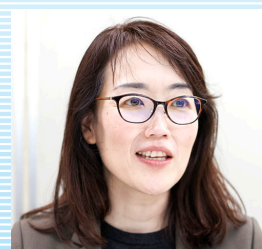
株式会社ゾウ 取締役