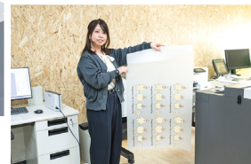
SC-G6050は、省スペースで全てフロントオペレーションなので壁際に設置でき、各種自動メンテナンス機能を搭載していて安定稼働、修理費などのコストも低減できる