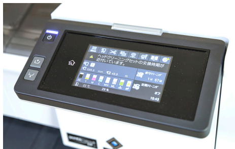
清掃・交換・エラーなどが液晶パネルに警告表示されるので画面に従い作業するだけで印刷ミスを防いで安定稼働