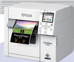
カラーラベルプリンター CW-C4020M