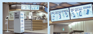
【TAG-COFFEE STAN(D)】109シネマズニ子玉川 店舗