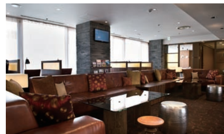
自宅、職場の続くサードプレイスとして様々なビジネスツールを完備し、ビジネスシーンに合わせて選べる滞り場が魅力。