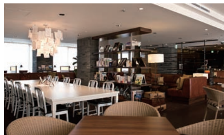
Nタワー最上階にあるビジネスラウンジ。〈細部にまでこだわったインテリアが創造性を刺激する〉

所在地 東京都港区 開業 2013年3月 業種 ホテル業 URL www.princehotels.co.jp/shinagawa/ntower