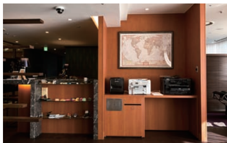
ビジネスラウンジ内の「PX-675F」「PX-1700F」