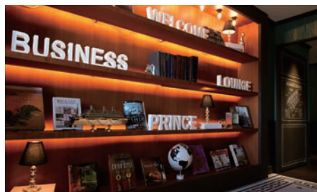
ラウンジの内装テーマは「BUSINESS VOYAGE」(ビジネスの旅)