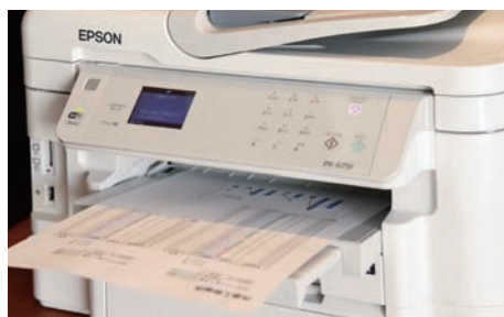
出張時でもビジネスラウンジで資料を修正して印刷。