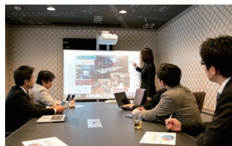
ミーティング後に出力、情報共有に一役買っている。