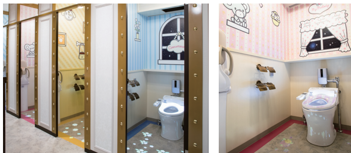
キャラクター雰囲気にあわせた映像コンテンツのイメージとなっている

今回、サンリオピューロランドではディスカバリープラザのトイレをリニューアル。そこに導入されたのが、光とプロジェクションによる新たな空間演出を実現するために新発売されたエプソンのプロジェクター「ライティングモデル EV-105」です。「EV-105」は、女性トイレにある5つの個室にそれぞれ設置。人気キャラクターのプレートのある扉を開けると、個室にはキャラクターをあしらった壁紙でキャラクターのお部屋を訪れたようなイメージになっています。