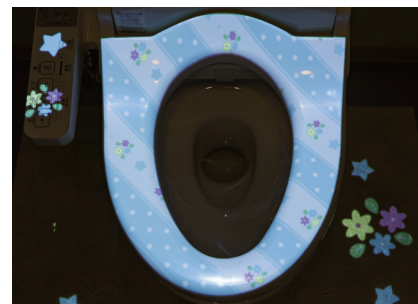
利用者がトイレ個室に入ると便座部とマット部に星や花のインタラクションが始まる